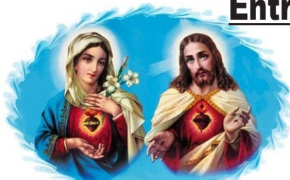
Sagrado Coração de Jesus e Maria

Uma feliz iniciativa da Legião de Maria, em suas atividades legionárias, levaram a umas 20 famílias até agora, e serão bem mais, a efetuarem a entronização da imagem do Sagrado Coração de Jesus e Maria em suas casas.