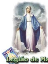
Legião de Maria

Turmas: Início dia 07 de março - 2ª feira às 9h e às 15h. Inscrições na secretaria da Paróquia.